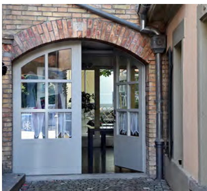
Polygonschule Schiffлаube 50 Friedensbewegung