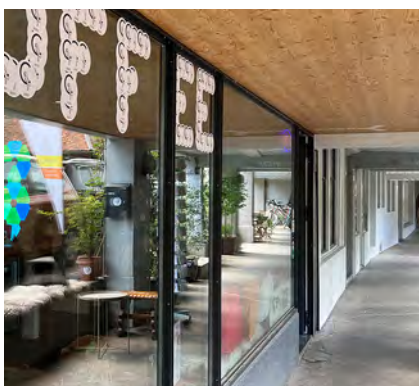
Cafecoachingclub Gerbergasse 44 Gleichberechtigung