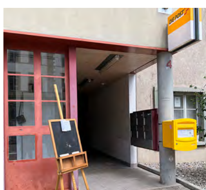
MattePostBrocki Schiffлаube 2 Gentech