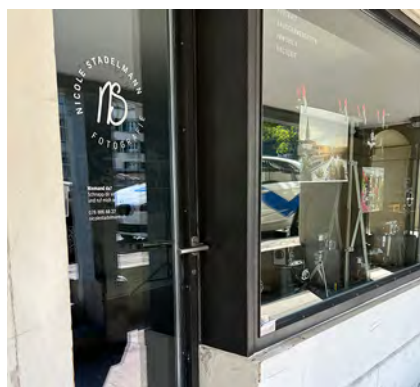
Fotoatelier Nicole Stadelmann Schiffлаube 28, Weltraum