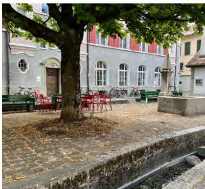
Wöschhüsi - Gerbergasse 29 Umwelt