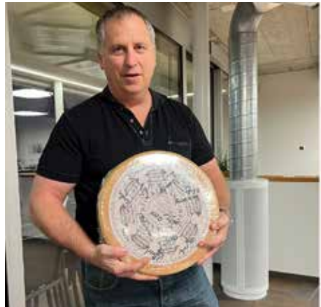
Marc Frick, Autor